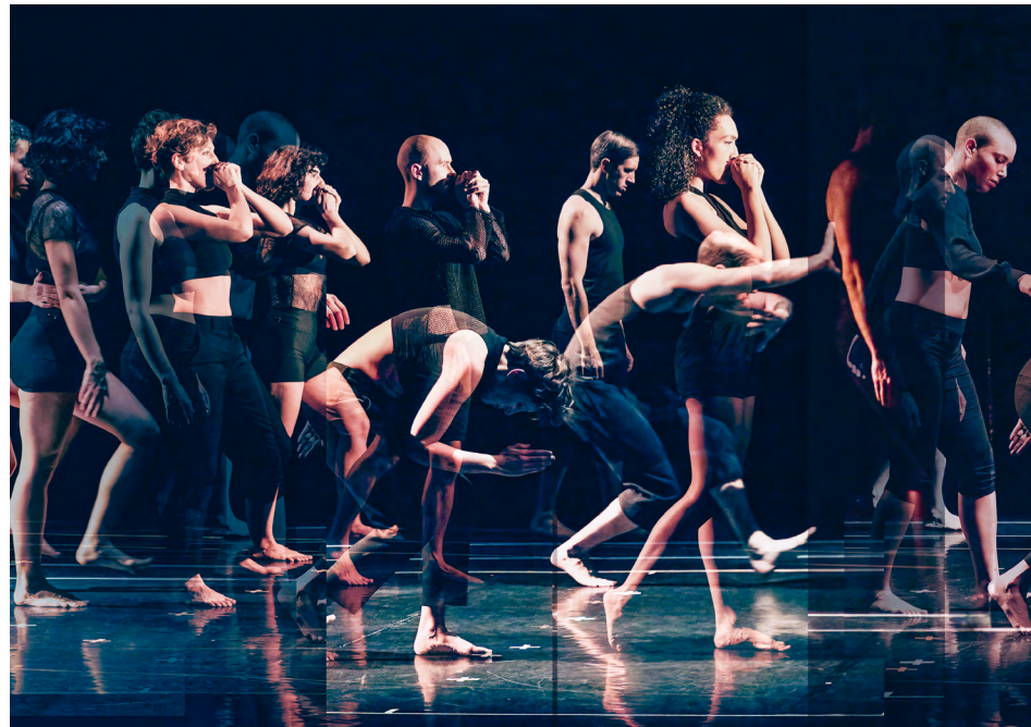
SUZANNE © Filip Forestier