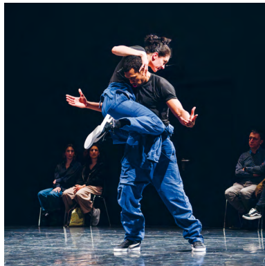
© Davide Picci - TROIS C-L