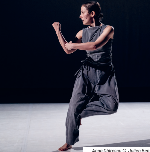
Anna Chirescu © Julien Benhamou - CCN Creteil EMKA